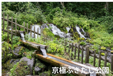
京極ふきだし公園