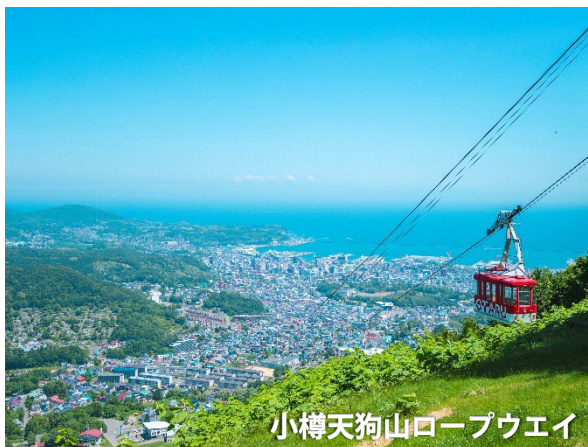
小樽天狗山ロープウェイ