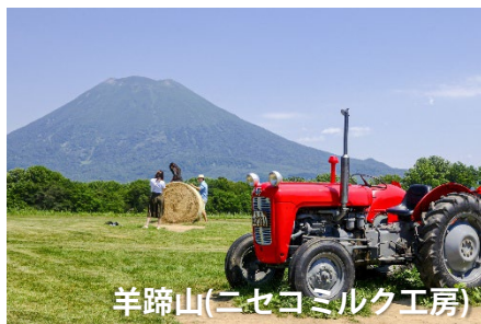
羊蹄山(ニセコミルク工房)