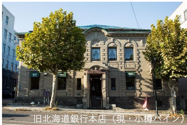
旧北海道銀行本店（現・小樽バイン）